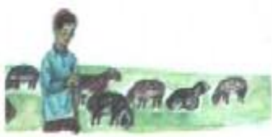
یایئئم ----- ائقئئم

ائمام - ائنام - آلتئن - یاقئم لی - یئقئلیار